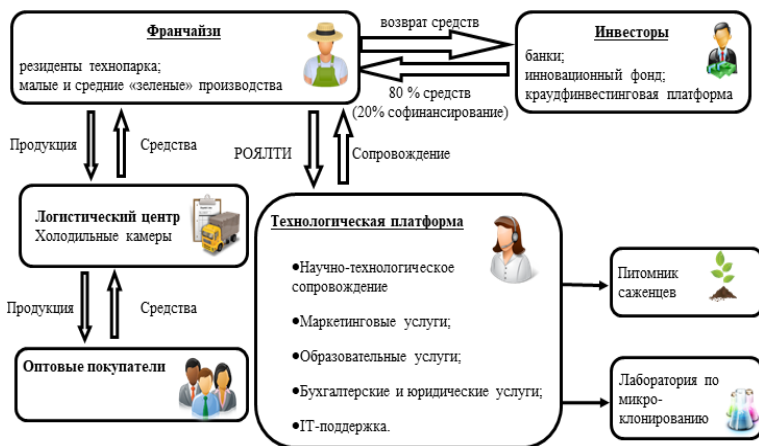
Рис. 1. Бизнес-модель коммерциализации

Создание бизнеса в органическом растениеводстве сопряжено с затратами на подготовку и проведение экономических расчетов, маркетинговых исследований, сертификацию производства, закупку посадочного материала высокого качества, разработку и приобретение необходимых знаний по органической технологии выращивания, установлению новых деловых контактов. Как показывает опыт становления органического производства, ключевой предпосылкой для преодоления барьера является наличие адекватной бизнес-модели, за основу которой мы приняли схему франчайзинга (рис. 1) [1, 2].